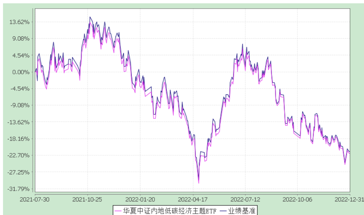
华夏中证内地低碳经济主题交易型开放式指数证券投资基金 份额累计净值增长率与业绩比较基准收益率历史走势对比图 (2021 年 7 月 30 日至 2022 年 12 月 31 日)

注：根据本基金的基金合同规定，本基金自基金合同生效之日起 6 个月内使基金的投资组合比例符合本基金合同中投资范围、投资限制的有关约定。