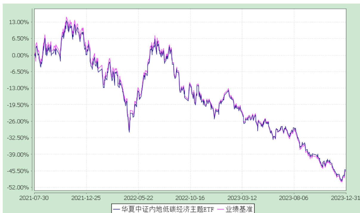
华夏中证内地低碳经济主题交易型开放式指数证券投资基金 份额累计净值增长率与业绩比较基准收益率历史走势对比图 (2021 年 7 月 30 日至 2023 年 12 月 31 日)