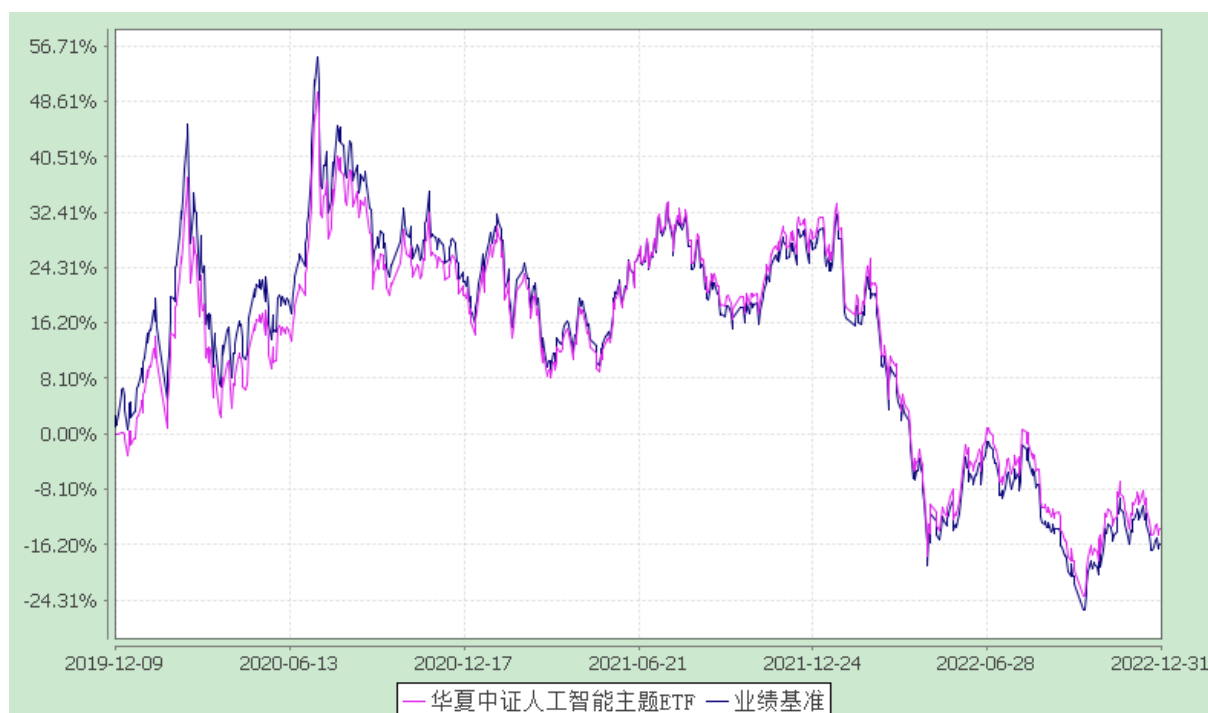
华夏中证人工智能主题交易型开放式指数证券投资基金 份额累计净值增长率与业绩比较基准收益率历史走势对比图 (2019 年 12 月 9 日至 2022 年 12 月 31 日)