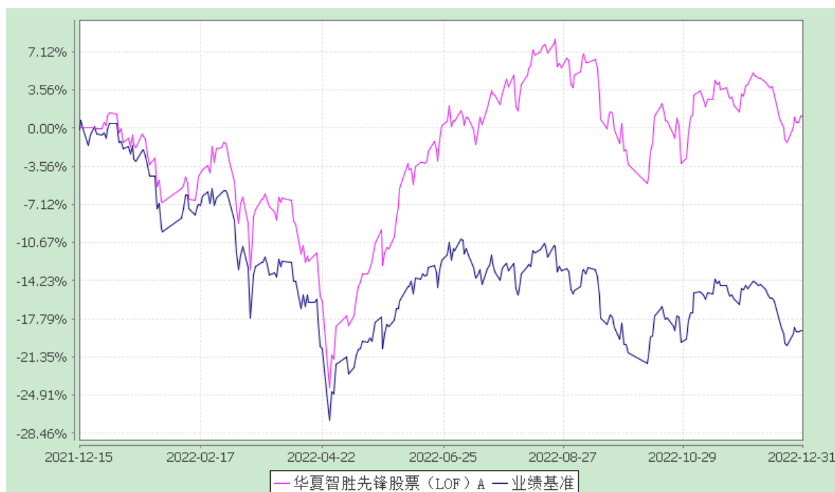
华夏智胜先锋股票 C