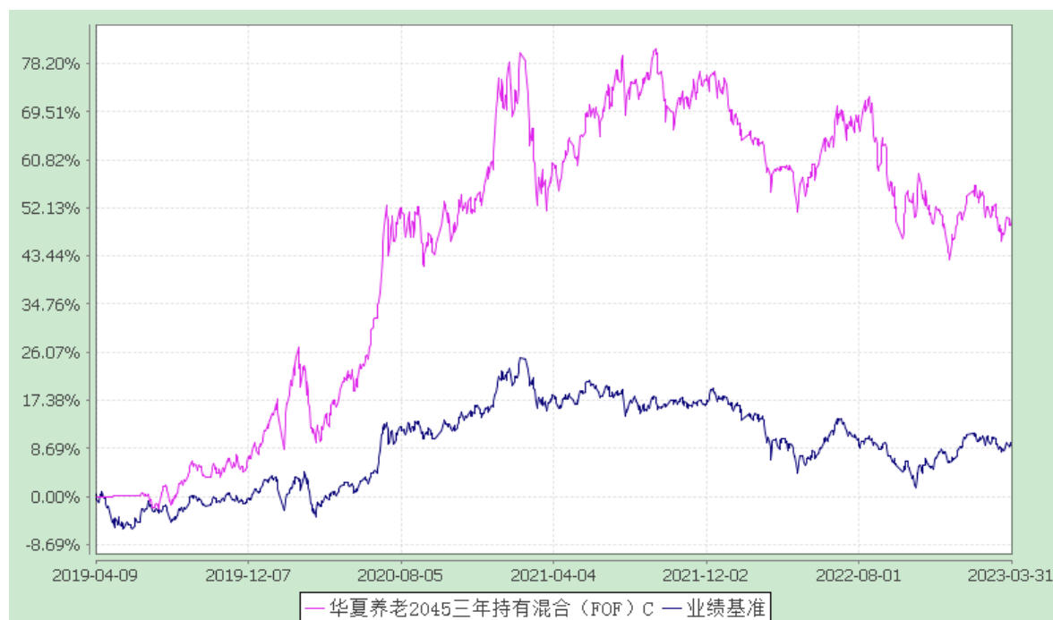
华夏养老 2045 三年持有混合（FOF）Y：