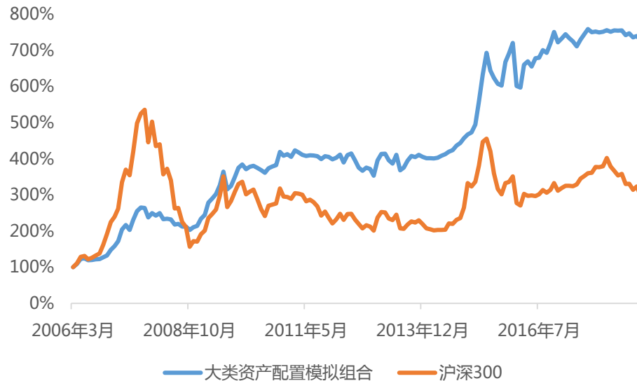
图表：大类资产配置模拟组合 2006 年至今主要风险收益指标分年度汇总